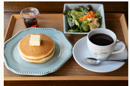
パンケーキ・サラダ ¥930(税込)