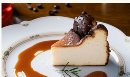
バスクチーズケーキ ¥680 (税込)