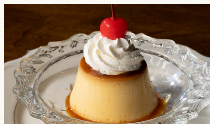
昔ながらの固めのプリン ¥450 (税込)

ライスパフと抹茶クリーム、抹茶アイスに、餡子や栗、最中などがのった和風パフェです