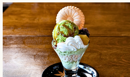
抹茶パフェ ¥950 (税込)

ガトーショコラのアイスにクリームやナッツをたっぷりトッピングした食感の楽しいサンデーです