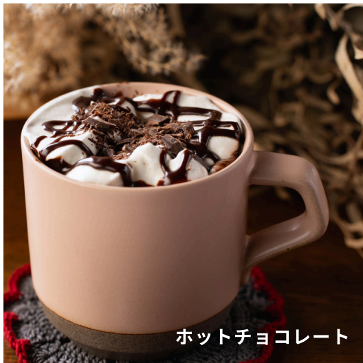
ホットチョコレート