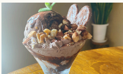
チョコレート&ナッツのサンデー ¥900 (税込)

ガトーショコラのアイスにクリームやナッツをたっぷりトッピングした食感の楽しいサンデーです