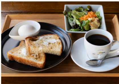
トースト・卵・サラダ ¥910(税込)