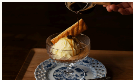
アフォガード ¥600 (税込)