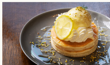
はちみつとレモンのパンケーキ ¥1050 (税込)

バニラアイスと生クリームの上に、キャラメルソースとナッツの蜂蜜漬けをかけた、間違いない美味しさ！