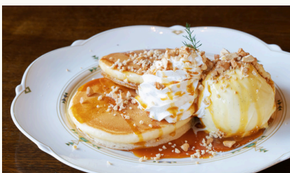
キャラメルナッツパンケーキ ¥1100 (税込)

バニラアイスと生クリームの上に、キャラメルソースとナッツの蜂蜜漬けをかけた、間違いない美味しさ！