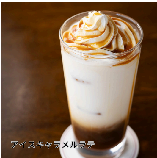
アイスキャラメルラテ