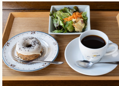
ヴィーナッツ・サラダ ¥980(税込)